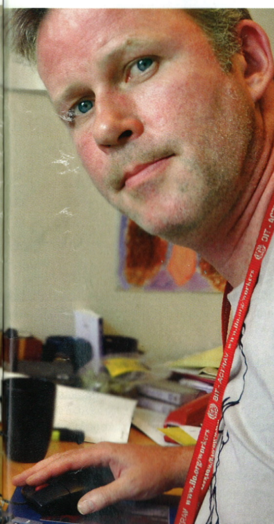
Personal er meget gode verktøy.

NTL har gjennomført en begrenset undersøkelse blant de øverste tillitsvalgte i NTLs organisasjonsledd. Av de 173 som har svart sier 60 prosent at de aldri har brukt Compendia.